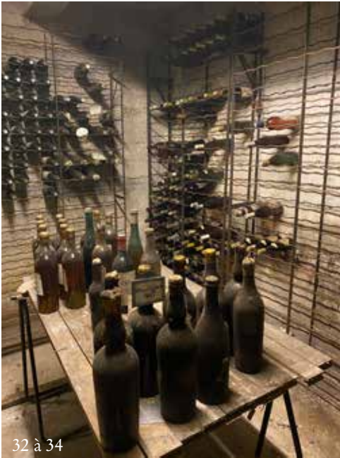
32 à 34